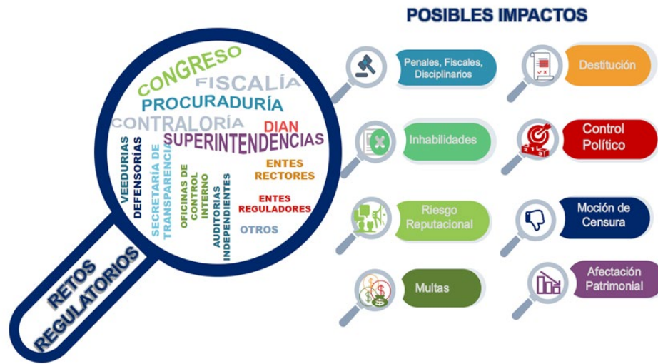
Figura 1 Sistemas de vigilancia y control e impactos

sus dependientes y funcionarios a la hora de cumplir con sus obligaciones para el logro del objeto misional.