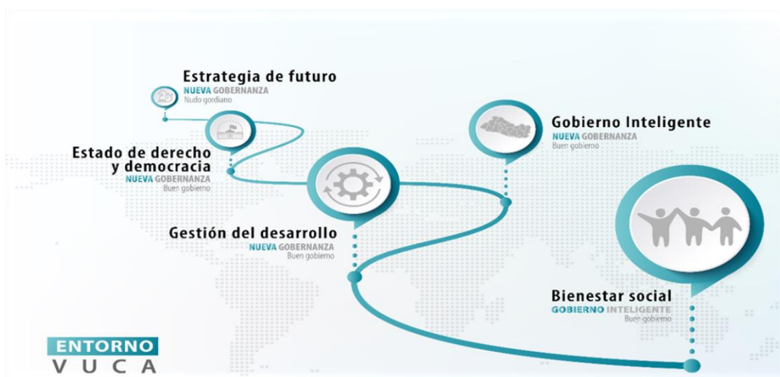
Figura No 3. Zona SICA: hacia un Gobierno Inteligente

Teniendo ello en consideración, en un entorno VUCA, hoy el medio para alcanzar el buen gobierno es el Gobierno Inteligente, tal como se muestra en la figura No 3.