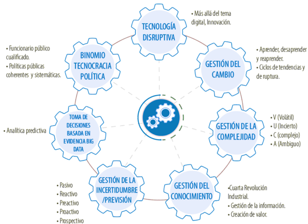
Figura No 1. Atributos del Gobierno Inteligente