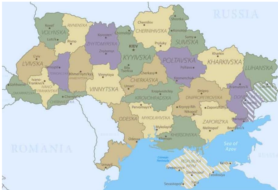
Imagen 1. Mapa de Ucrania y las regiones en conflicto.

Posterior a lo sucedido en Crimea, el movimiento proruso se expandió a otros territorios ucranianos, especialmente la zona del Donbás, donde en ese mismo 2014, se autoproclamaron dos Repúblicas Populares; Donesk y Lugansk (Imagen 1).