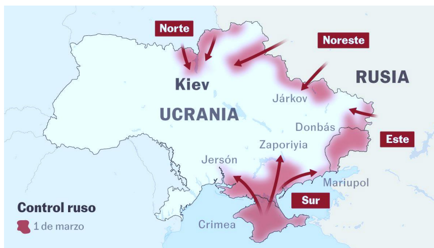
Imagen 3. Ofensiva rusa en ucrania 1 de marzo, 2022

El punto de no retorno, se dio el 21 de febrero de 2022, cuando el presidente ruso Vladimir Putin, firmó un decreto mediante el cual reconoce como independientes la República Popular de Donetsk y Lugansk, y tres días más tarde, anunció, el despliegue de una operación militar especial en territorio ucraniano, lo siguiente incluyó ataques a las principales ciudades ucranianas y de ahí batallas, incluso urbanas, por el control de zonas como Kiev, Jarkov, Odesa, Mariúpol y Melitópol.