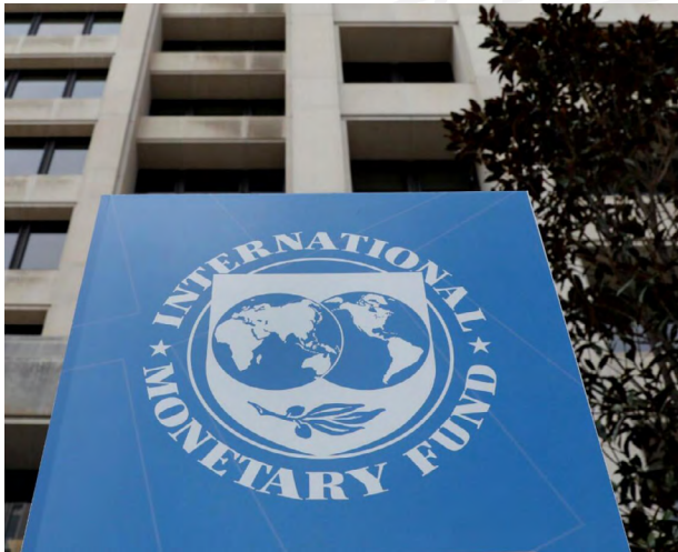
Nota. Tomado del FMI, 2025

El informe concluye que el producto global está proyectado para un 3% al final del 2025 y un 3.1% en 2026. Ello, a pesar de la incertidumbre tarifaria y un dólar débil, así como la expansión fiscal en diversas jurisdicciones de peso global. Lo interesante de subrayar, es la presencia de una inflación global baja.