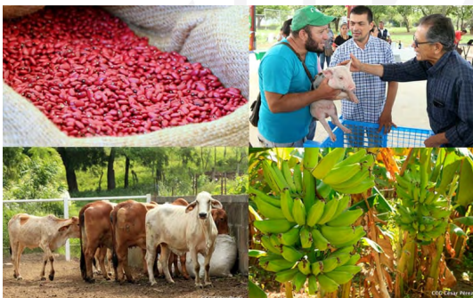
Nota. El 19 Digital

Más allá del impacto económico, este crecimiento tiene un fuerte componente social. El desempeño del sector agrícola es clave no solo para la balanza comercial, sino también para la seguridad alimentaria, el empleo rural y la reducción de desigualdades en las zonas más vulnerables del país.