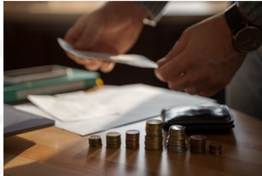
Nota. Tomado de Freepick.

El proyecto plantea la modernización del esquema de subsidios a las tasas hipotecarias, con el fin de ampliar las oportunidades para las familias panameñas y dinamizar el mercado inmobiliario. Se espera que la medida no solo mejore las condiciones de financiamiento, sino que también impulse la construcción y contribuya al crecimiento del sector vivienda, uno de los motores tradicionales de la economía nacional, tras este paso, la iniciativa pasará a tercer debate, última etapa de su eventual sanción presidencial.