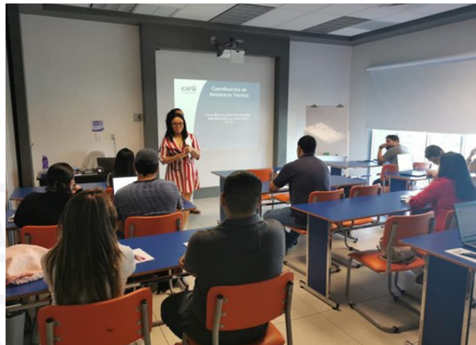
Nota. Fotografía tomada del Archivo ICAP, 2019

No obstante, este crecimiento no necesariamente se traduce en una expansión estructural del sistema. El informe subraya que el aumento en la matrícula no ha venido acompañado de un incremento proporcional en las tasas de graduación, lo que sugiere que una parte importante del estudiantado no logra concluir sus estudios universitarios. Esta brecha de finalización, unida a los desafíos de calidad en la educación secundaria, limita la capacidad del país para transformar el acceso en movilidad social real.