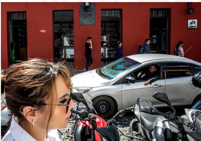
Fachada de la Farmacia Roca, ubicada en La Antigua Guatemala; que es un claro ejemplo de gentrificación en América Central.

La metáfora del iceberg es ilustrativa de lo que hoy acontece, y es utilizada por Milano para etiquetar otro término: el overtourism . Y para ejemplificarlo utiliza a pequeñas localidades, como la ciudad de Manta en Ecuador, o bien las islas del Caribe. El iceberg contrasta con lo que se observa en la superficie, pero lo que está abajo trae una miríada de problemas más profundos y estructurales.