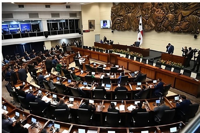
Nota. Pleno de la Asamblea Nacional, 2 de julio de 2024.

El proyecto de ley 21-25 busca transformar la Carrera Administrativa y profesionalizar al Estado panameño con estándares internacionales.