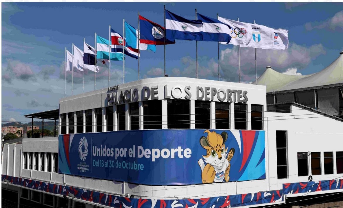
Nota. Fotografía tomada de Norceca Guatemala.

No obstante, para consolidar una educación activa en América Latina se requiere inversión sostenida, formación docente especializada y voluntad política. Moverse es aprender; y educar con movimiento es educar para la vida.