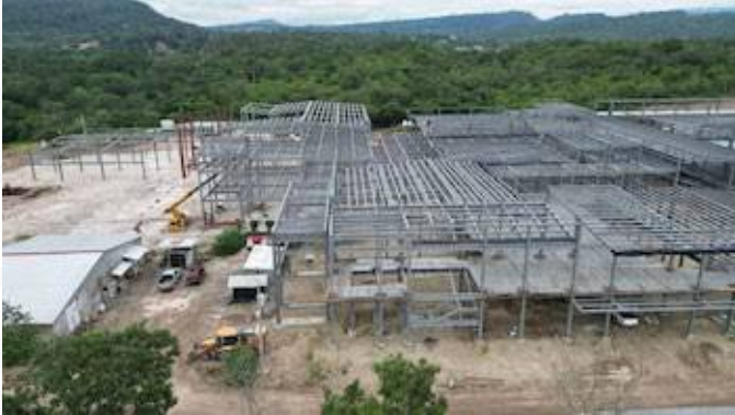
Nota. Fotografía tomada de Infobae.

En el marco de la integración centroamericana, la salud pública se posiciona no solo como un derecho fundamental, sino como un indicador crítico de la eficiencia administrativa y la cohesión social. Los Estados miembros del Sistema de la Integración Centroamericana (SICA) enfrentan un desafío marcado por la transición demográfica, la persistencia de enfermedades transmisibles, y el auge de padecimientos crónicos. Bajo esta premisa, el análisis de los sistemas de salud regionales revela una heterogeneidad estructural que condiciona la capacidad de respuesta ante crisis sanitarias y la sostenibilidad del bienestar a largo plazo.