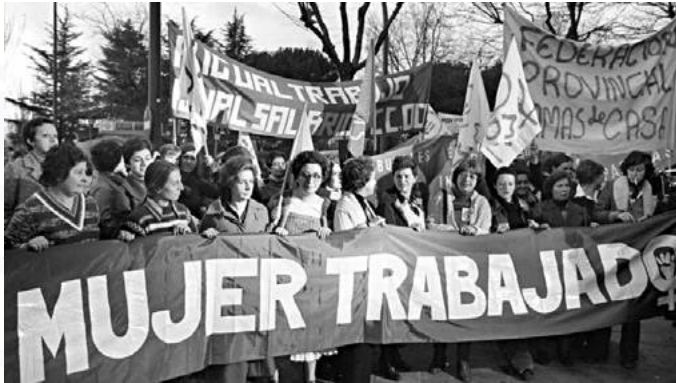
Nota. Fotografía tomada de Canal 13.

El Día Internacional de la Mujer, celebrado cada 8 de marzo, constituye una fecha significativa para reflexionar sobre los avances logrados en materia de igualdad de género y, al mismo tiempo, analizar los desafíos que continúan enfrentando las mujeres en diferentes regiones del mundo.