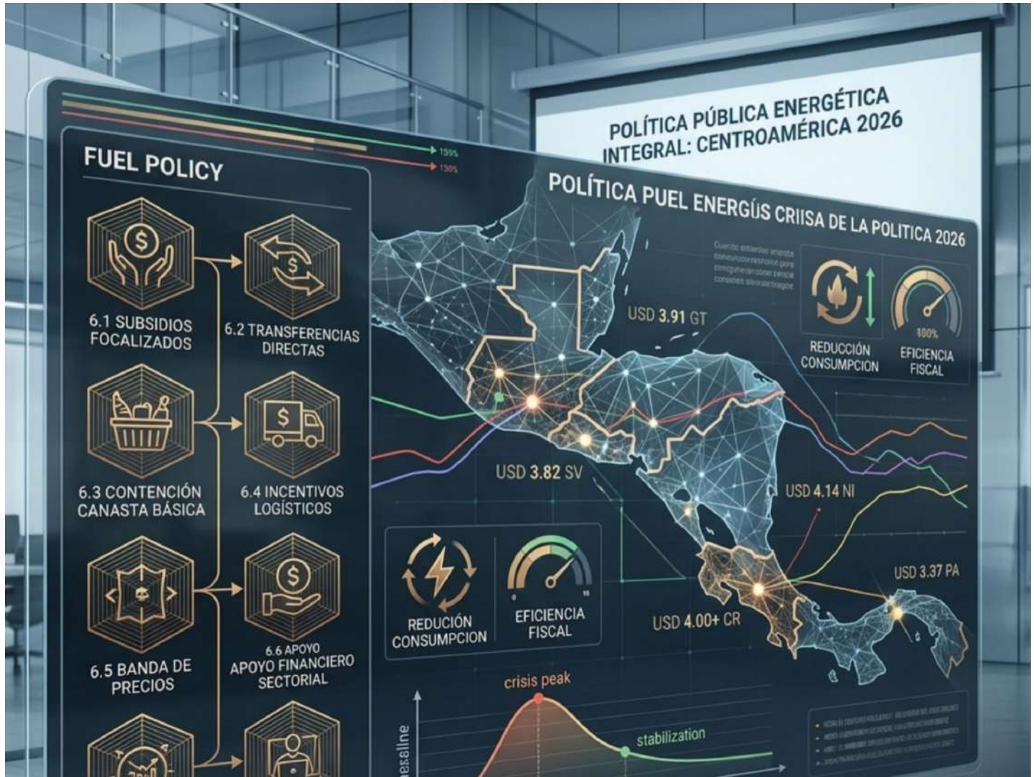
Nota. Imagen realizada con inteligencia artificial.