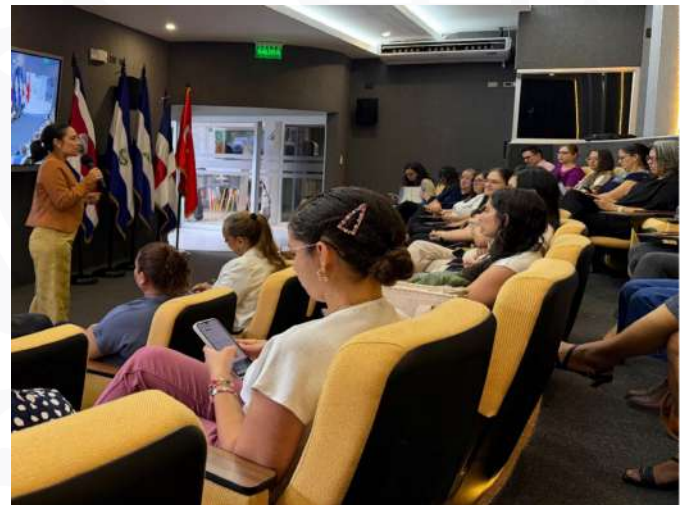
Nota. Fotografía tomada del archivo ICAP.

Los cuatro asesores reportaron con notable consistencia un hallazgo que trasciende cualquier indicador cuantitativo: el programa no solo fortaleció empresas, sino que transformó a las personas que las lideran. En muchos casos, el acompañamiento comenzó por escuchar, por ordenar prioridades, por devolver claridad a una empresaria que llevaba meses gestionando en soledad una carga operativa que la desbordaba. Solo desde ese punto de equilibrio