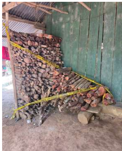
Nota. Imagen tomada de Facebook el grafico de Oriente 5 de junio 2019.