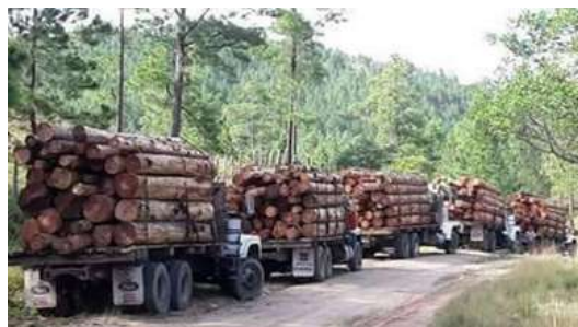
Nota. Imagen tomada de Facebook CDN Escuintla.

En términos cotidianos, esto se refleja en escenas comunes del área rural centroamericana: hogares que dependen de la leña porque el gas propano resulta inaccesible; agricultores que amplían parcelas agrícolas sobre áreas boscosas debido al agotamiento de los suelos; comunidades enteras afectadas por sequías prolongadas que obligan a migrar o vender ganado; o poblaciones costeras que observan como las inundaciones revelan que el cambio climático ya no es una amenaza abstracta o futura, sino una realidad que impacta directamente en la vida diaria de millones de personas